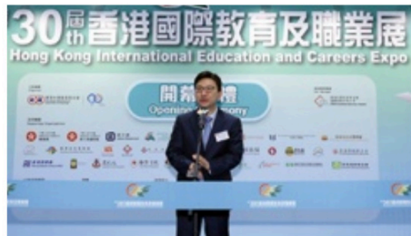
勞工及福利局局長孫玉菡（右）及教育局副局長施俊輝（左）均在開幕禮致辭

教育局副局長施俊輝則指，每位學生的志向和能力都有所不同，教育局一直致力為青年提供靈活多元的升學途徑，鼓勵學校進行多樣化的實驗探索活動，讓學生早些了解到自己的興趣能力，掌握不同出路，為未來升學就業做好準備。他又提到局方在本學年起推出「大灣區職涯探索之旅」計劃，透過親身觀察和體驗，幫助高中生了解大灣區的升學及職涯發展機遇。